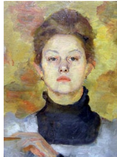
links: Selbstbildnis um 1895 Tempera auf Lw. 40x30 cm WVZ 15

Kultur Bahnhof Eller Vennhauser Allee 89 in Düsseldorf 21.4.-26.5.2013 · Di-So 15-19 Uhr www.kultur-bahnhof-eller.de