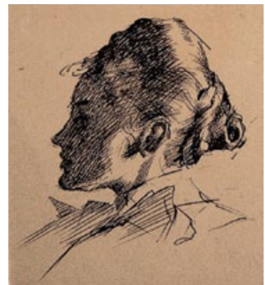
links: Portraitzeichnung der Schwester um 1898 ca 8x7 cm ohne WVZ-Nr.