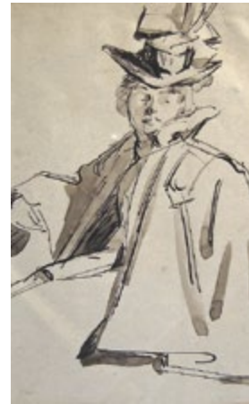
Mitte rechts: Frau in schwarzem Kleid. 1900 Federzeichnung ca 15x9 cm ohne WVZ-Nr.