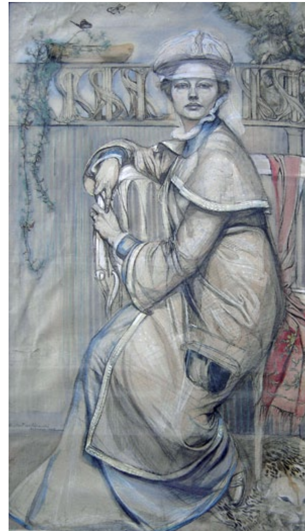
Abbildung unten: Selbstbildnis in Reisekleidung , 1903 Kohle, Aquarell und Deckfarbe auf getöntem Papier ca 175x90 cm. WVZ 162

Gertrud von Kunowski (1877-1960) eine vergessene Düsseldorfer Jugendstilmalerin.