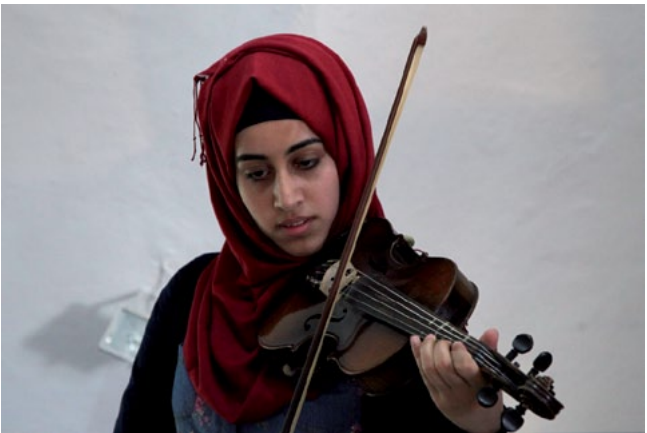
Al Kamandjati Music Centre, 2014

In der modernen palästinensischen Musik drückt sich der Schmerz über den Verlust von nahen Angehörigen und die Vertreibung, sowie Wehmut und Sehnsucht nach einem anderen Leben aus. Gleichzeitig setzt sie, trotz ihrer Melancholie, bei den Musikern, Sängerinnen und Sängern positive Energien frei. Sie hat etwas Befreiendes und holt die Zuhörer für eine gewisse Zeit aus dem oft schwierigen Alltag.