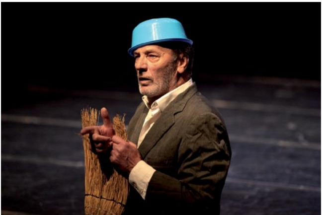
Mohammad Bakri, The Optimist

Gespielt wird für Kinder, Jugendliche und Erwachsene. Im Repertoire sind europäische Stücke, griechische Dramen und Stücke palästinensischer Autoren mit aktuellem Zeitbezug, wie zum Beispiel die auch in Europa bekannten Gaza Monologe.