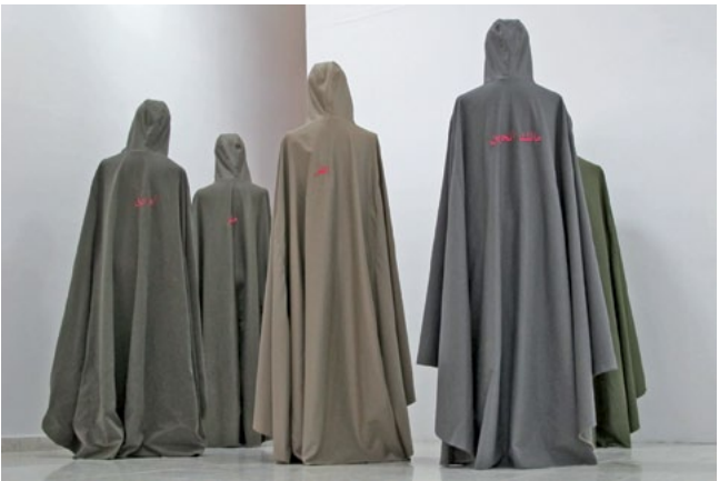
Birzeit University Gallery, 2012

Umso erstaunlicher ist die Vielfalt der Kunstszene. Neben Malerei spielen Videoarbeiten und avantgardistische Installationen eine große Rolle. Es gibt eine akademische Ausbildung an Hochschulen und Wettbewerbe, wie „The young artist of the year“, die den Künstlerinnen und Künstlern helfen, auch im Ausland bekannt zu werden. Das Interesse richtet sich allerdings mehr nach Osten, Richtung Golfstaaten, wo im Moment der Geldhahn aufgedreht wird. Aber auch dort dauert eine Kunstmesse wie die Gulf Art Fair nur drei Tage und die Anzahl der Galerien hält sich in Grenzen. Allerdings gibt es auch in Ramallah Kunstauktionen die auf reges Interesse stoßen und vom Palestinian Art Court in Jerusalem organisiert werden.