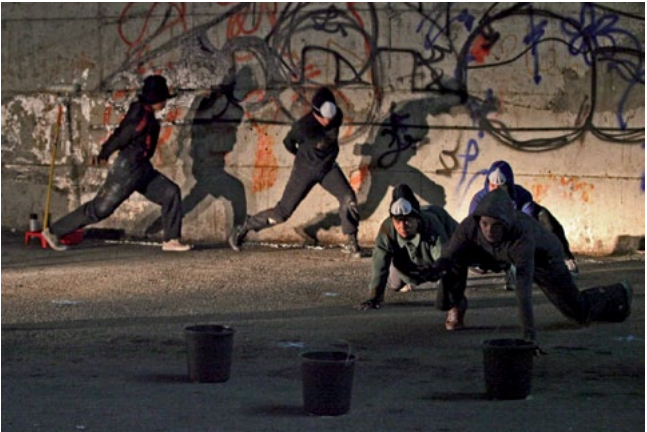
Interlope Ramallah 2015

Ein Schauspieler, der auf einer Guckkastenbühne steht, hat die Rampe zwischen sich und dem Publikum. Eine Opernsängerin sogar einen ganzen Orchestergraben. Ein Performancekünstler, vor allem, wenn er auf der Straße auftritt, ist dem Publikum schutzlos ausgeliefert. Zudem weiß er vielfach nicht, wie es ausgeht.