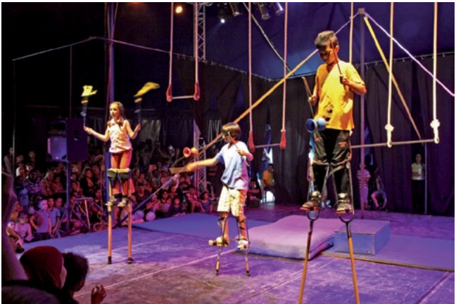
Palestinian Circus School 2014

Darüber hinaus soll die Zirkusschule den Zirkus in ganz Palästina bekannt machen und die Zirkuskünste dafür nützen, kreatives Potential zu entwickeln. Die Schule hat sich zudem zum Ziel gesetzt, ein akademisches Zirkusprogramm zu entwickeln. Im Moment gibt es 185 Schülerinnen und Schüler aus Jerusalem, Jenin, Al Faraa, Hebron, Ramallah, Birzeit und aus dem Flüchtlingslager Al Jalazone.