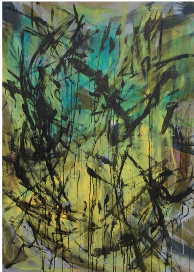
oben: ohne Titel . 2014 . Tusche u. Öl . 165x120 cm links: „am Steg“ . 2014 . Tusche . 38x29 cm rechts: „Luftschiff“ . 2012 . Tusche . 140x100 cm