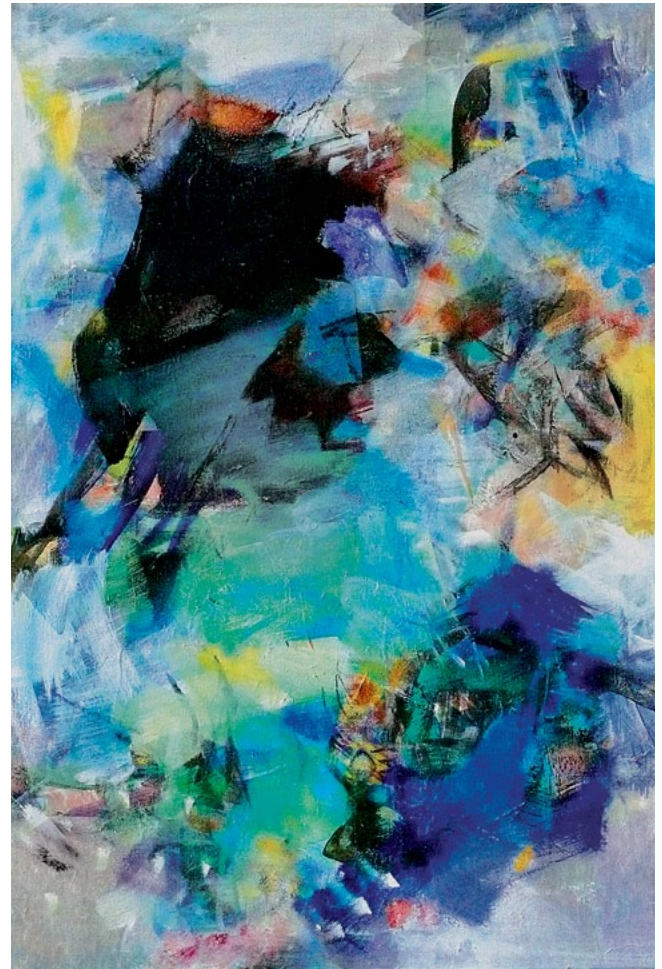
oben: ohne Titel . 2012 / 13 . 120x80 cm beide unten : ohne Titel . 2013 . 50x40 cm

Im Kultur Bahnhof zeigte er mit japanischen Künstlerkollegen seine Bilder zuletzt 2011 in der Ausstellung Enishi, ein erneutes Zusammenführen von Herkunft und Gegenwart.