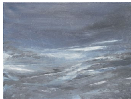
Mitte: o. Titel, 1998 Eitempera auf Leinwand, 30x42 cm