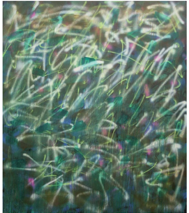
ohne Titel . 2013 230x200 cm . Öl- und Sprühfarbe auf Leinwand

Anica Bucker hat ihr Studium an der Kunstakademie als Meisterschülerin von Prof. Brandl abgeschlossen. Sie nahm an mehreren Ausstellungen teil, derzeit mit Kunstfeldrucken an der Ausstellung "Drucken", Stiftung Museum Kunstpalast.