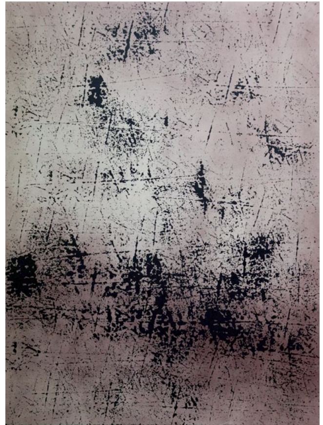
ohne Titel . 2015 . Acryl auf Leinwand . 200x150 cm