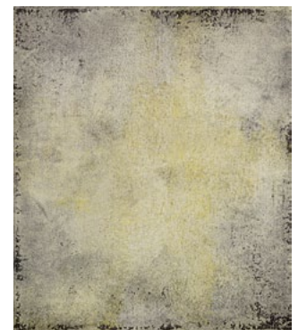
ohne Titel . 2014 Acryl auf Lwd . 70x60 cm