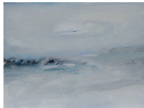
unten: o. Titel, 1998 Eitempera auf Leinwand, 30x42 cm