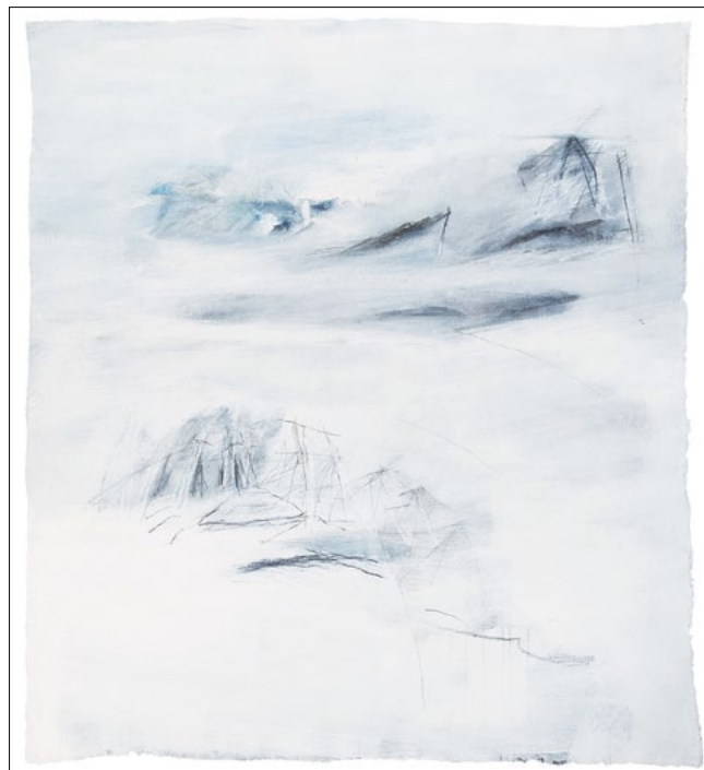
oben: „vor der Erinnerung“, 1992 Dispersion, Graphit, Kreide, Silberstift, 90x80 cm

Manche eindrucksvolle Ausstellung von Künstlerkollegen war auch ihrer konzeptionellen und organisatorischen Arbeit im Bunker zu verdanken.