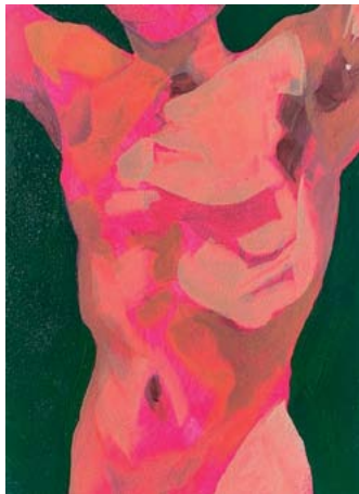
If the body were not the soul, what is the soul? | Acryl und Öl auf Holz | je 25 x 18 cm | 2023