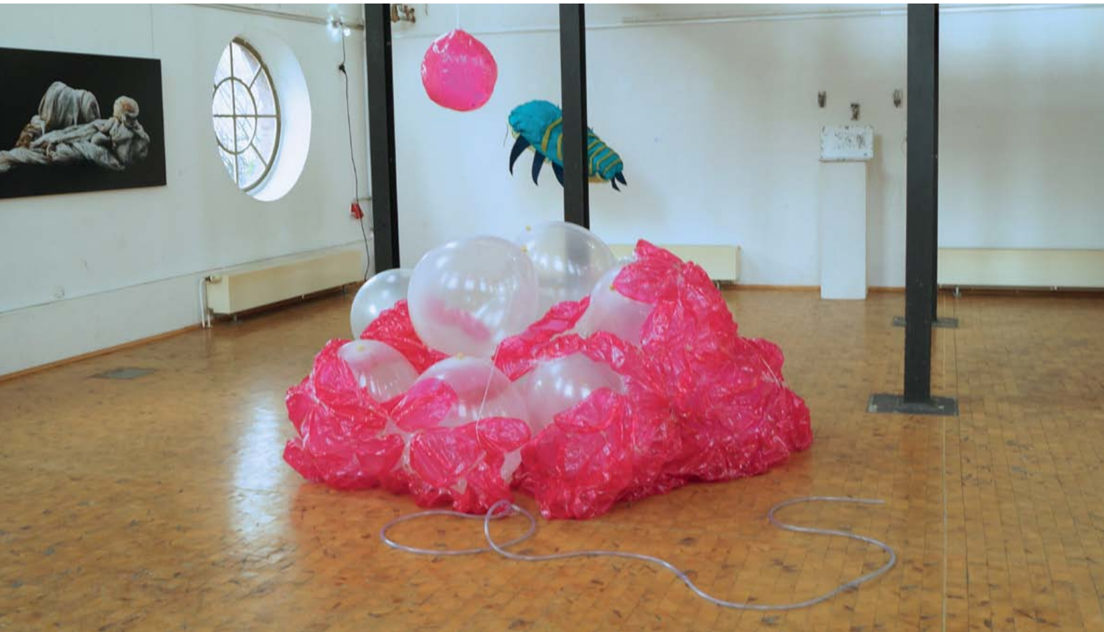
Materialkampf | Vinyl, Luftballons und Maurerlot | Variable Größe | 2025