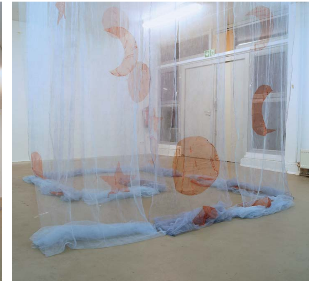
Himmelszelt 1 + 2 | Moskitonetz, Lack und Maurerlot | raumabhängig und modular | 12 mal 500 x 100 cm | 2025