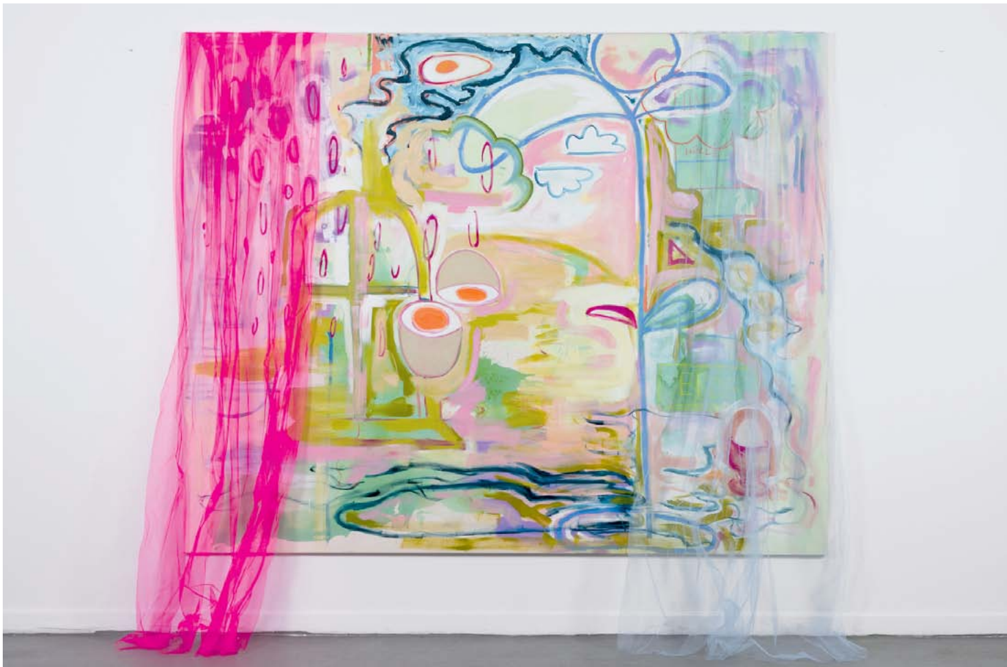
Schatz, wie möchtest du dein Ei? | Öl- und Acrylfarbe, Pastell auf Leinwand, Tüll | 200 x 250 cm | 2025