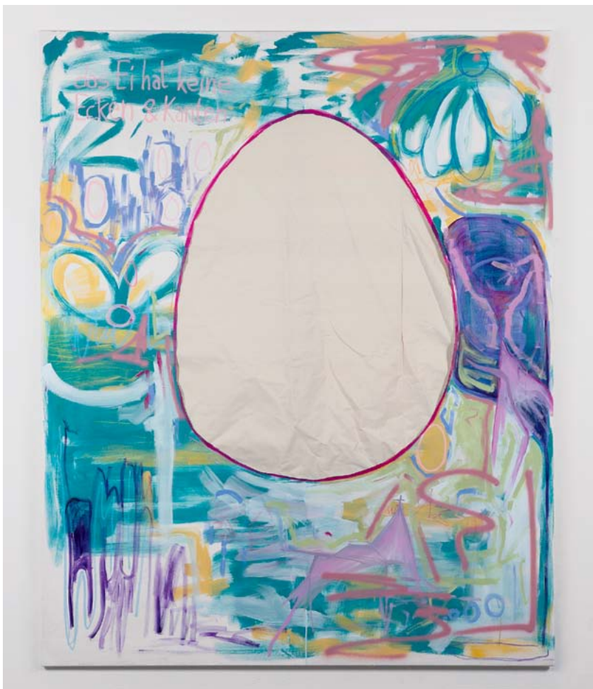
Eiertanz | Öl- und Acrylfarbe, Pastell auf Leinwand | 250 x 200 cm | 2025